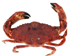
紅岩蟹 (Red rock crab)