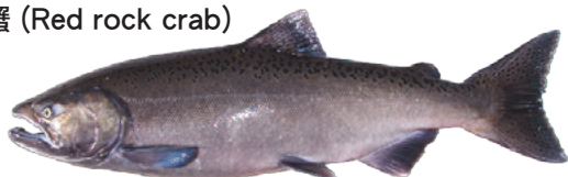
帝王三文魚 (Chinook Salmon) ♥